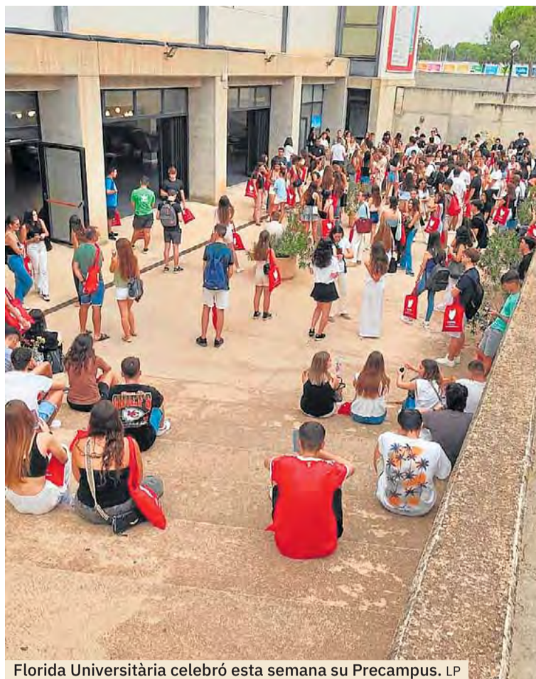
Florida Universit aria celebr  esta semana su Precampus. LP

El proyecto educativo de Florida Universit aria se encuentra en constante crecimiento, actualizando sus m todos de ense anza e implemen-