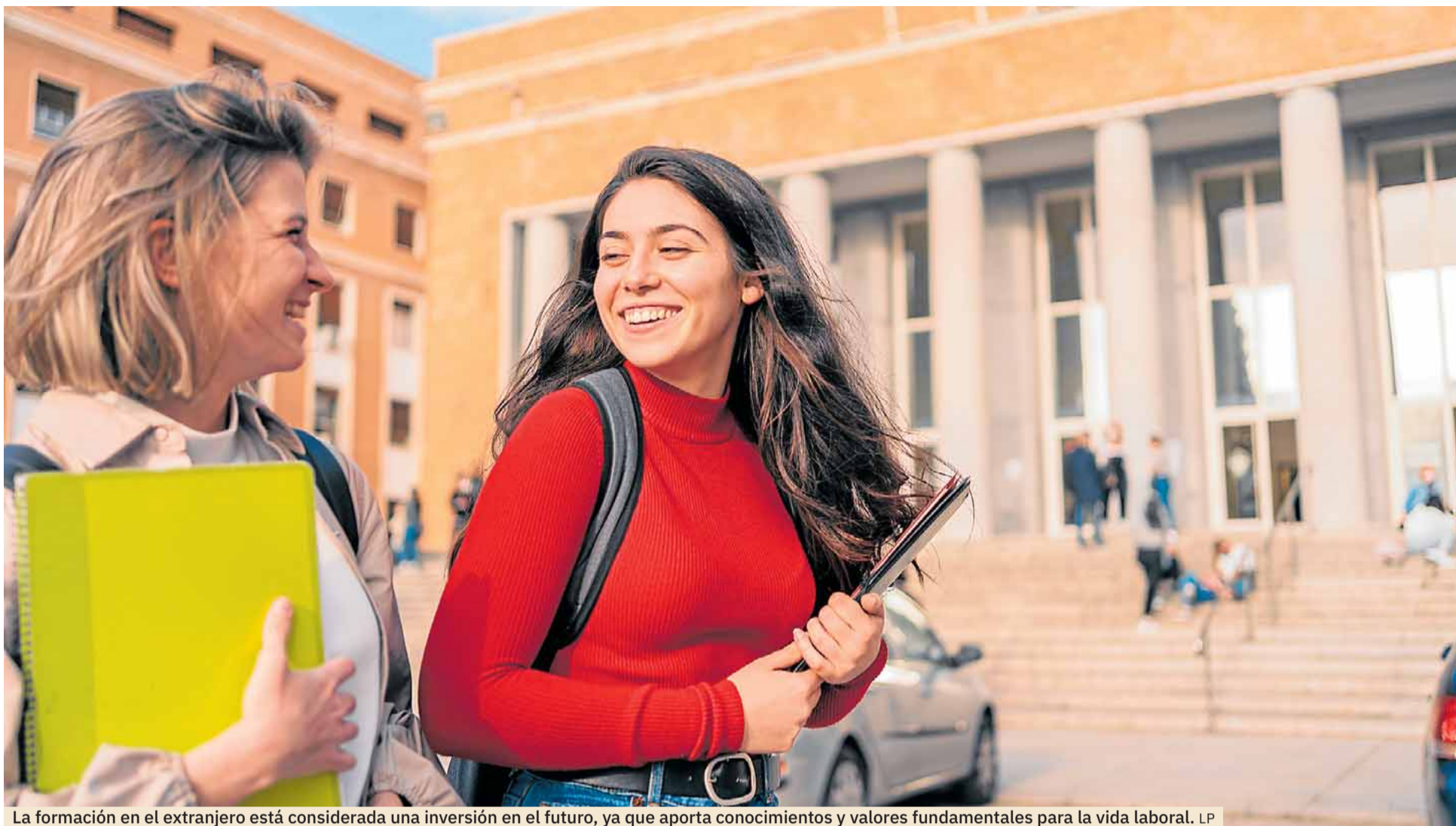
La formación en el extranjero está considerada una inversión en el futuro, ya que aporta conocimientos y valores fundamentales para la vida laboral. LP