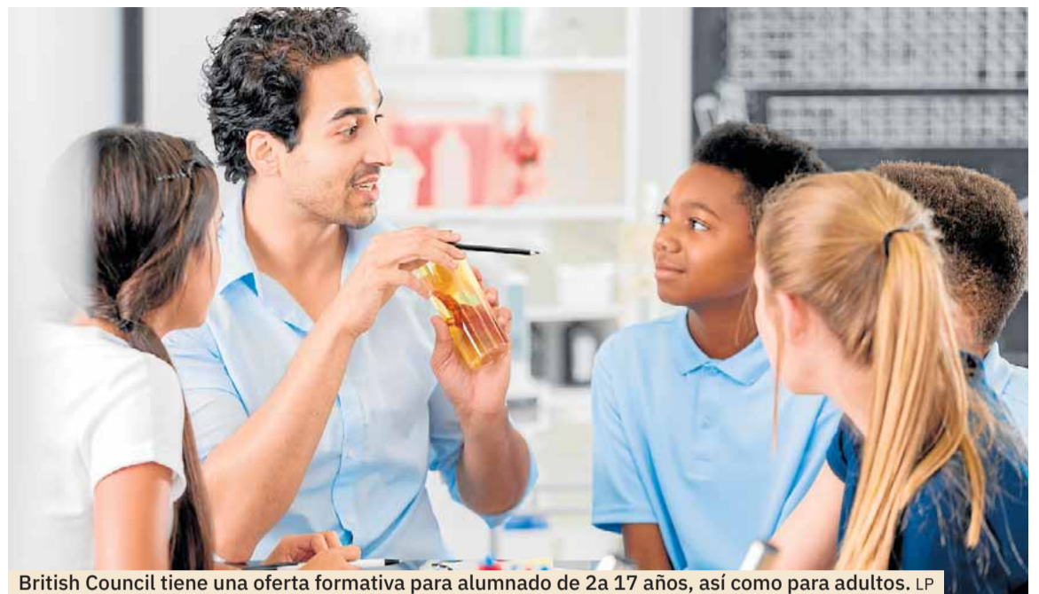
British Council tiene una oferta formativa para alumnado de 2 a 17 años, así como para adultos. LP

Para los más pequeños, British Council ofrece clases para niños y adolescentes de entre 2 y 17 años. Estos cursos se imparten en las instalaciones del Colegio Alemán, ubicado en la calle Jaime Roig. Los programas abarcan desde el refuerzo educativo para etapas como infantil, primaria y secundaria, hasta la