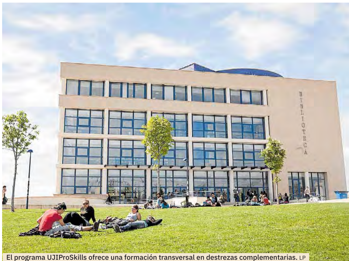
El programa UJIProSkills ofrece una formación transversal en destrezas complementarias. LP

Dentro de la formación que ofrece UJIProSkills, destacan las 'soft skills', competencias socio-personales que pueden adquirirse a través de cursos exclusivos para el estudiantado y el antiguo alumnado UJI, diseñados para responder a las demandas laborales. Estos cursos, cuya inscripción se inicia el 9 de septiembre, abordan temas como: el liderazgo; la comunicación integral para la empleabilidad; la ética profesional y laboral; y la creatividad y la resolución de retos.