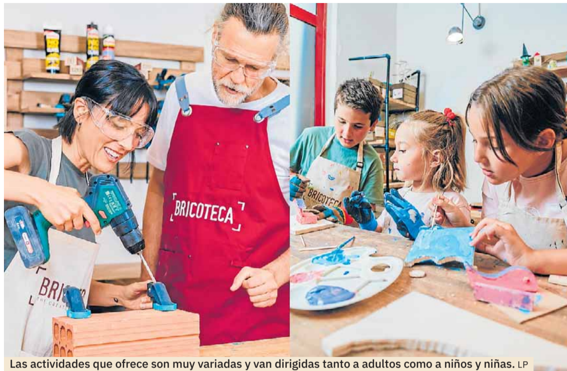
Las actividades que ofrece son muy variadas y van dirigidas tanto a adultos como a niños y niñas. LP

que poder crear tus propios muebles y decorarlos a tu gusto. ¿No tendrás que decorar algún espacio de tu casa? Con este curso los alumnos aprenderán técnicas tradicionales para trabajar la madera así