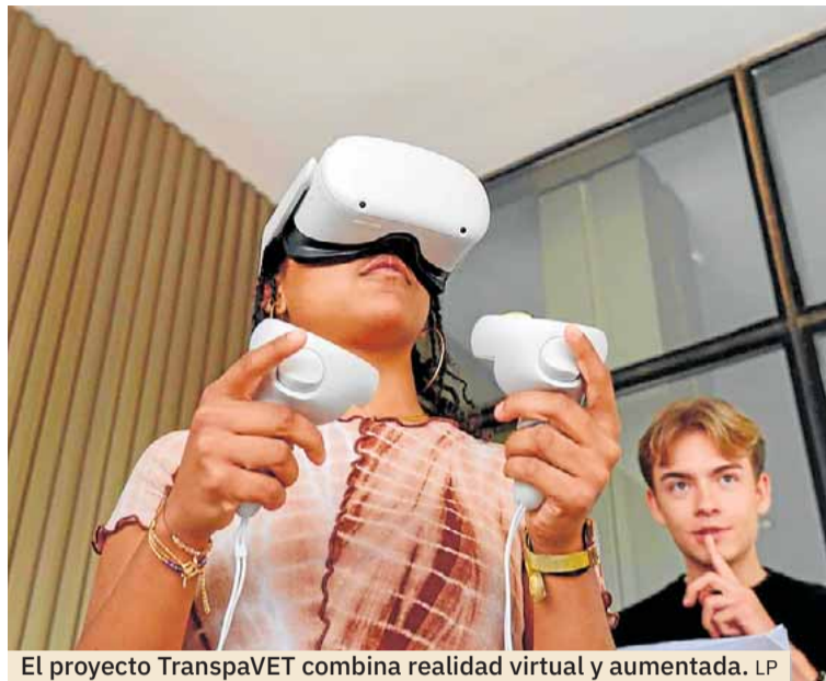
El proyecto TranspaVET combina realidad virtual y aumentada. LP

El Legal Tech Lab, por ejemplo, ha surgido como un punto de encuentro donde los profesionales del Derecho presentes y futuros aprenden cómo las nuevas tecnologías afectan a la práctica legal. Otras inicia-