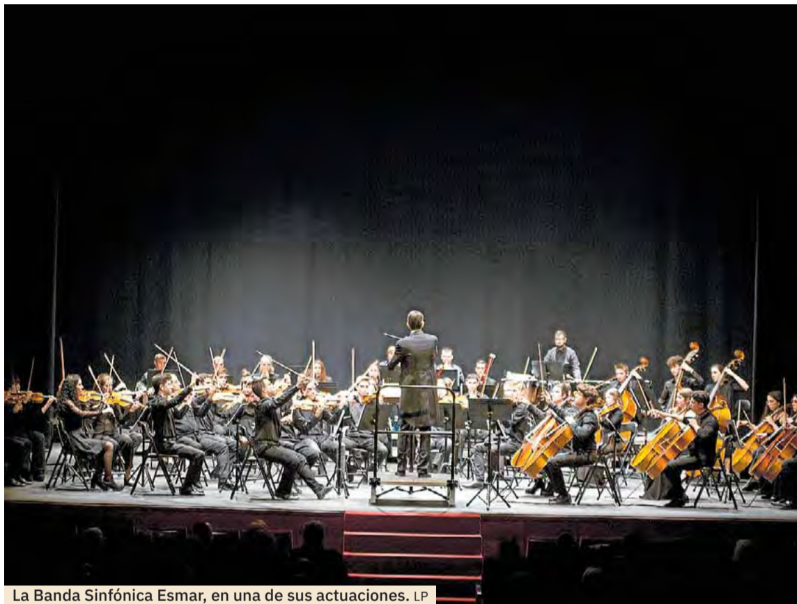
La Banda Sinfónica Esmar, en una de sus actuaciones.

Además, Esmar ofrece programas de especialización que atienden a distintas franjas de edad y niveles de experiencia. Estos programas, que incluyen Esmar Young Ta-