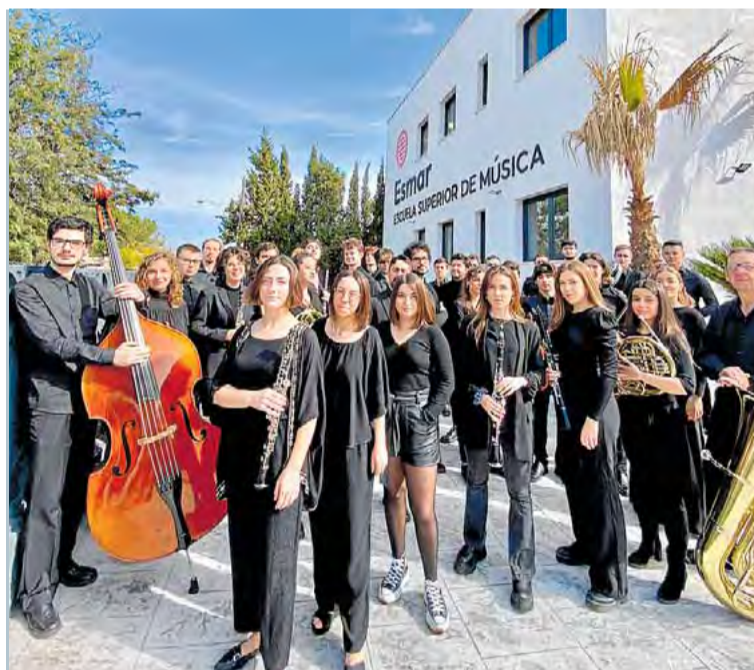
Los estudiantes eligen su plan de estudios según sus intereses. LP

lent, Esmar Professional Program y High Speciality Program, se caracterizan por su flexibilidad, ya que permiten a los estudiantes diseñar su propio plan de estudios en función de sus intereses y necesidades. Esta personalización es un elemento clave en la metodología educativa de Esmar.