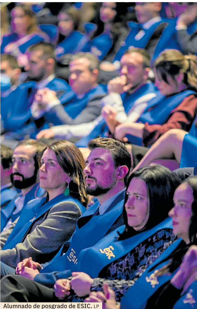
Alumnado de posgrado de ESIC. LP

ESIC. Octubre es el mes perfecto para impulsar una carrera profesional